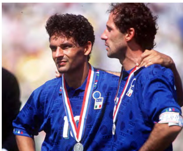
رو برتو باجو در حسرت از دست دادن جام جهانی

برزیل بعد از ۲۴ سال فاتح جام جهانی شد . جالب آنکه ۲۴ سال قبل هم برزیل به دنبال پیروزی مقابل ایتالیا قهرمان جهان شده بود .