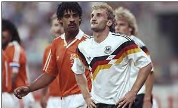
اخراج رودی فولر و فرانک رایکارد از بازی

از طرفی آلمان غربی که در گروه D قرار داشت به عنوان تیم اول به مرحله یک هشتم صعود کرد . در آنجا آنها باید با هلند که تیمی قدری بود دیدار می کردند . در یک بازی پر برخورد آلمان غربی ۲ - ۱ هلند را شکست داد . در این بازی رودی فولر (آلمان) و فرانک رایکارد (هلند) به خاطر درگیری از بازی اخراج شدند .