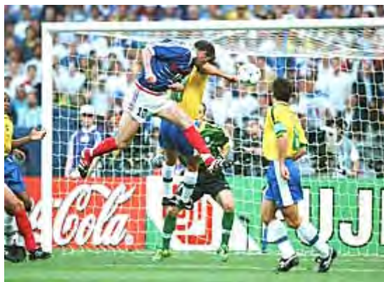
زین الدین زیدان در حال به ثمر رساندن گل دوم فرانسه

فرانسه و برزیل فینال جام شانزدهم را در استادیوم France Stade de شهر پاریس برگزار کردند . خیلی از طرفداران و همچنین کارشناسان بر این باور بودند که برزیل برای پنجمین بار جام را به خانه می برد . اما این بازی ، بازی متفاوت بود . فرانسه که انگیزه زیادی برای تصاحب جام داشت ، بازی را کاملا در دست گرفت بود تا اینکه در دقیقه ۲۷ عجوبه این تیم ، زین الدین زیدان اولین گل بازی را وارد دروازه برزیل کرد . در دقیقه یک وقت های تلف شده نیمه اول این باز هم زیدان بود که گلزنی کرد تا فرانسوی ها با خیالی راحت به رختکن بروند .