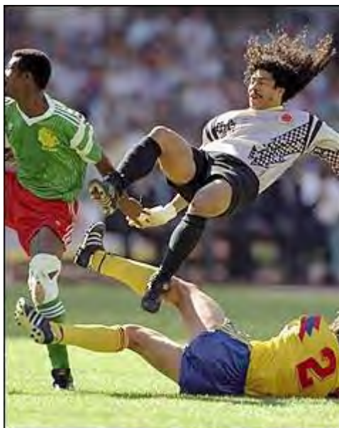
هیگوئینا ، دروازه‌بان افسانه ای کلمبیا

این نخستین دوره از بازیها بود که پس از انقلاب ایران در سال ۱۹۷۹ ، به طور مستقیم از تلویزیون پخش می شد . در زمان پخش مستقیم یکی از بازیها ( اسکاتلند - برزیل) وقوع زلزله ای مرگبار در منطقه رودبار و منجیل ، جان هزاران ایرانی را گرفت .