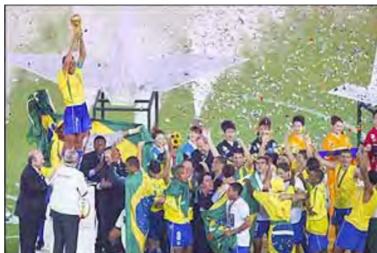
کافو کاپیتان تیم ملی برزیل ، جام را بالا برده است

آلمانها قصد جبران این گل را داشتند که در دقیقه ۷۹ با زهم رونالدو برای برزیل گلزنی کرد و باعث تا تیمش برای پنجمین بار فاتح جام جهانی شود .