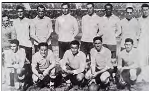
تیم ملی اورگوئه میزبان و قهرمان نخستین دوره