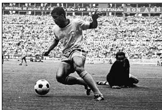
جرزینهو تیم برزیل را در برد ۴ بر ۲ مقابل پرو رهبری می کرد

ایتالیا نیز برای رسیدن به فینال ، پس از صعود از گروهش مکزیک ، میزبان بازیها و آلمان غربی را شکست داد . ایتالیا و برزیل در بازی فینال در حالی مقابل هم قرار می گرفتند که تیم برنده به سومین عنوان قهرمانی خود دست می یافت و می توانست برای همیشه جام ژول ریمه را به خانه ببرد .