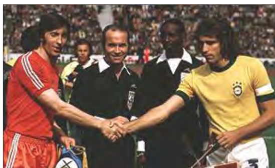
کاپیتانهای برزیل و لهستان در دیدار رده بندی جام ۱۹۷۴ آلمان غربی

بازی رده بندی با پیروزی یک بر صفر لهستان پایان یافت و برزیل ، قهرمان دوره پیش نتوانست با ستارگان بجا مانده از جام ۱۹۷۰ به مقامی بهتر از چهارمی دست یابد .