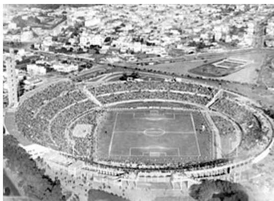
ورزشگاه استادیو سنتناریو در اروگوئه ، که بازی فینال هم در آن برگزار شد

گرچه اروگوئه به تیمهای اروپایی پیشنهاد داده بود که هزینه سفر آنها را به عهده می گیرد ، ولی تنها چهار تیم از این قاره ، یعنی فرانسه ، یوگوسلاوی ، رومانی و بلژیک بودند که حاضر به انجام یک سفر طولانی با کشتی به کشور اروگوئه شدند . از قاره آمریکا نه تیم در این جام شرکت کردند .