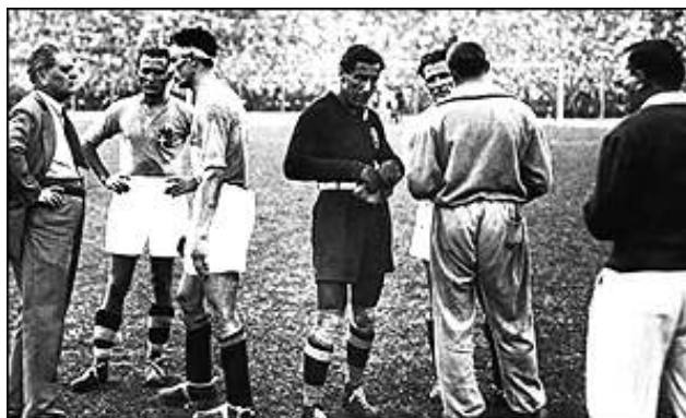
بازیکنان ایتالیا قبل از وقت اضافه برای مقابله با چک اسلاواکی در فینال

بازی فینال بین تیمهای میزبان ، یعنی ایتالیا و چک اسلاواکی انجام شد . در این بازی دو تیم با نتیجه ۱ بر ۱ بازی را به وقت اضافی کشاندند . درحالی که ۵۵۰۰۰ تماشاچی در استادیوم شرکت داشتند ، این تیم چک اسلاواکی بود که اولین گل بازی را در دقیقه ۷۹ بنمر رسانده بود . آنها می توانستند بازی را با دو گل دیگر به پایان رسانند ، اما دو فرصت خوب گلزنی را از دست دادند تا اینکه در دقیقه ۸۲ ایتالیا بازی را به تساوی کشاند .