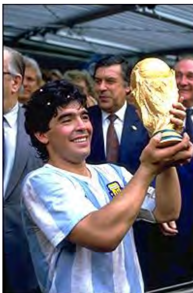
مارادونا بهترین بازیکن جام جهانی ۱۹۸۶

در این دوره از بازی ها ، مارادونا از سوی فیفا به عنوان برترین بازیکن برگزیده شد .