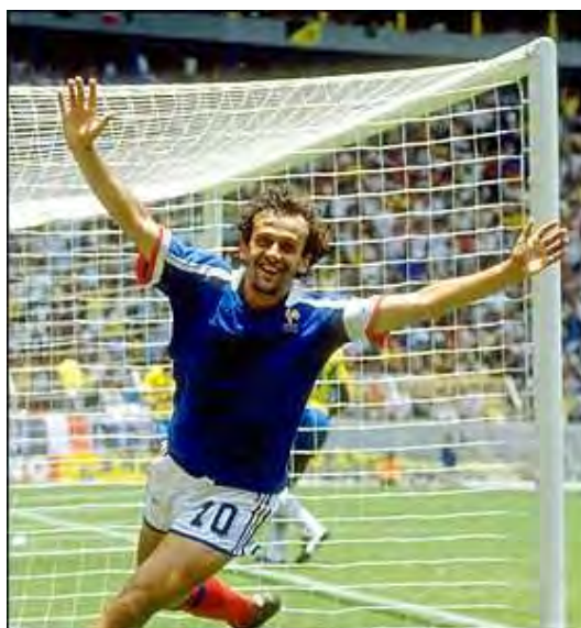
میشل پلاتینی، ستاره فرانسه در جام جهانی ۱۹۸۶

در مرحله یک هشتم نهایی تیمهای برزیل، آرژانتین، آلمان غربی، مکزیک، اسپانیا، انگلستان، فرانسه، بلژیک با شکست دادن حریفان شان به یک چهارم نهایی صعود کردند.