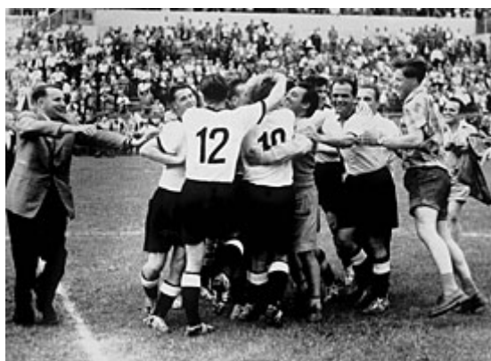
جشن قهرمانی آلمانها در جام جهانی ۱۹۵۴ سوئیس

در ۵ دقیقه آخر این آلمانها بودند که همه را با یک گل متحیر کردند . همین گل باعث پیروزی آلمان غربی و فتح جام برای اولین بار توسط این کشور شد (بدین ترتیب آلمان غربی در نخستین تجربه حضورش در جام جهانی به عنوان قهرمانی این بازیها دست یافت) . آلمانها از این بازی با نام "معجزه برن" (Wunder von Bern) یاد می کنند . برد آلمانها در شرایطی بود که تیم مجارستان ۸ بر ۳ در دور مقدماتی آلمان غربی را شکست داده بود .