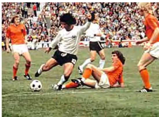
گرد مولر بازیکن افسانه ای و ماشین گلزنی ژرمن ها

بازی فینال با حضور بیش از ۷۵ هزار نفر در استادیوم المپیک مونیخ برگزار شد . این بازی نبرد ستارگان بود . آلمان غربی با مجموعه ای از بهترین بازیکنان تاریخ فوتبال خود چون سب مایر ، فرانس بکن باوئر ، برتی فوگتس ، پل براینتر ، گرد مولر ، ولفگانگ اورات ، راینر بونهوف و اولی هوینس در مقابل هلندی قرار گرفت که از مثلث طلایی یوهان کرویف و ران رینسن برینک ، جانی رپ بهره می گرفت .