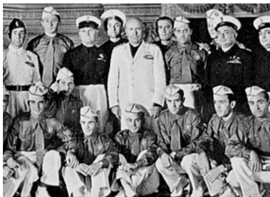
بازیکنان ایتالیا بعد از قهرمانی در جام جهانی ، در کنار موسولینی

این آخرین جام جهانی بود که پیش از جنگ جهانی دوم برگزار می شد که با شروع جنگ جهانی ۱۲ سال (۱۹۳۸ تا ۱۹۵۰) وقفه بین دو دوره جام جهانی افتاد .