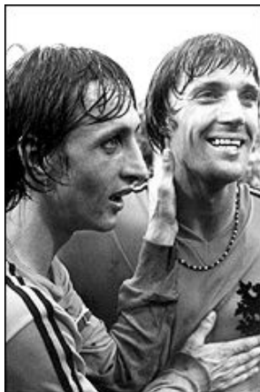
یوهان کرایف و جان نیسکنز

یک دقیقه پس از سوت آغاز بازی ، در حالیکه پای آلمانیها حتی یکبار هم به توپ نخورده بود ، اسطوره فوتبال هلند ، یوهان کرایف در محوطه جریمه آلمان سرنگون شد و داور نقطه پنالتی را نشان داد . یوهان نیسکنس هلندی پشت این ضربه پنالتی قرار گرفت و یکی از سریعترین گل‌های تاریخ جام جهانی را به سود هلند رقم زد .