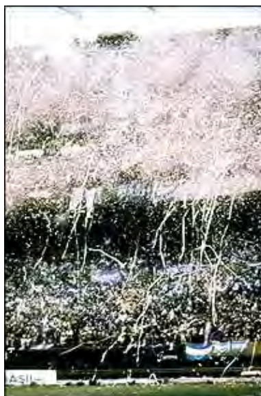
یکی از ورزشگاههای آرژانتین در این جام

سرانجام آرژانتین هم میزبان جام جهانی فوتبال شد . در آن زمان دولت آن کشور یک دولت نظامی دیکتاتور بود و بدین سبب مردم آرژانتین می ترسیدند که مشکلات سیاسی داخلی و خارجی ، و تاخیر در ساخت چند استادیوم ، آرژانتین را از لطف میزبانی محروم کنند . اما به هر حال بازیهای نهایی جام در این کشور آغاز شد .