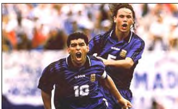
جواب آزمایش مارادونا مثبت در آمد و او از ادامه بازیها محروم شد

در این گروه آرژانتین بار دیگر مارادونا ، ستاره افسانه ای خود را که مدتی بخاطر مصرف مواد مخدر محروم بود ، در اختیار داشت . آرژانتین در دو بازی نخست خود در دو مقدماتی پیروز شد ، اما پس از اینکه جواب آزمایش مارادونا در خصوص استفاده داروی نیروزا افدرین مثبت در آمد و این بازیکن از ادامه بازیها محروم شد ، شیرازه این تیم از هم پاشید .