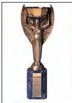
جام ژول ریمه

پس از تصاحب همیشگی جام ژول ریمه توسط برزیل ، جام بعدی در سال ۱۹۷۱ از میان ۵۳ طرح و توسط یک مجسمه ساز ایتالیایی ساخته شد و در سال ۱۹۷۴ رسماً معرفی شد .