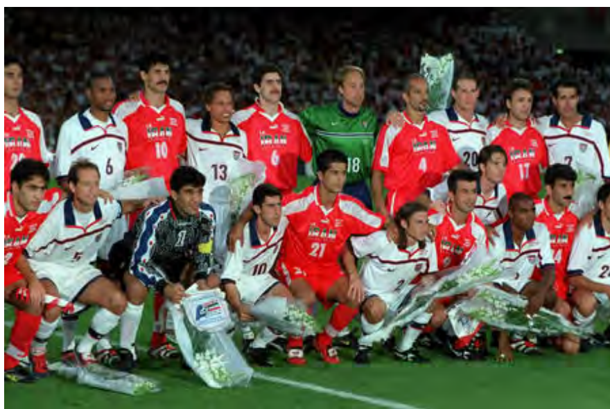
بازیکنان ایران و آمریکا قبل از بازی در کنار هم عکس یادگاری گرفتند

ایران در دور مقدماتی با تیمهای یوگسلاوی ، آلمان و آمریکا هم گروه شد . دو باخت در مقابل تیمهای یوگسلاوی (۱-۰) و آلمان (۲-۰) و یک پیروزی ۲ بر ۱ مقابل آمریکا در تاریخ ۳۱ خرداد ۱۳۷۷ و در ورزشگاه ژرلانته شهر لیون نتیجه کار ایران در این جام بود . هرچند ایران نتوانست از گروهش صعود کند ، اما موفق شد نتیجه بهتری نسبت به نخستین حضور خود در جام جهانی بدست آورد . حمید استیلی و مهدی مهدوی کیا دو بازیکنی بودند که برای ایران در مقابل آمریکا دو گل به ثمر رساندند .