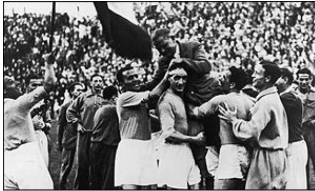
خوشحالی بازیکنان ایتالیا پس از نخستین قهرمانی

تیمهای آلمان و اتریش در بازی رده بندی به مقام های سوم و چهارم دست یافتند . این دیدار ۳ به ۲ به نفع آلمان تمام شد .