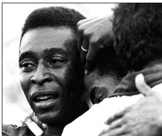
احساسات پله بعد از قهرمانی در جام جهانی ۱۹۷۰ مکزیک

اما اشتباهی که خط دفاعی برزیل انجام داد باعث شد تا بونینسینا برای ایتالیا گلزنی کند و بازی مساوی شود . در نیمه دوم برزیل بهتر بازی کرد و با سه گلی که در ۲۰ دقیقه توسط گرسون ، جرزینیو و کارلوس آلبرتو پیرا به ثمر رساند کار را برای ایتالیای ها بسیار دشوار کرد . و سرانجام بازی ۴ به ۱ به نفع برزیل تمام شد تا برای سومین بار جام را برنده شود و جام ژول ریمه را به خانه ببرد .