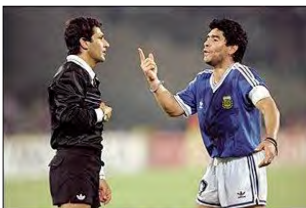
دیگو مارادونا در حال اعتراض به داور ، بعد از اخراج ۲ بازیکن آرژانتین

در پنج دقیقه آخر بازی دو بازیکن از آرژانتین از بازی اخراج شدند .