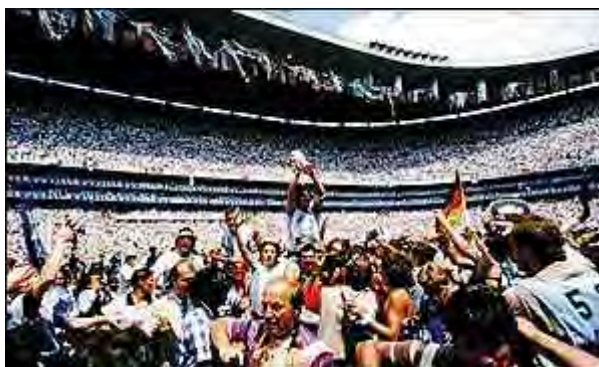
آرژانتین قهرمان جام جهانی ۱۹۸۶ مکزیک

ولی سه دقیقه بعد بوروچاگا گلی برای آرژانتین زد و به سبب همین گل آرژانتین در طول ۸ سال ، برای بار دوم جام را به خانه برد .