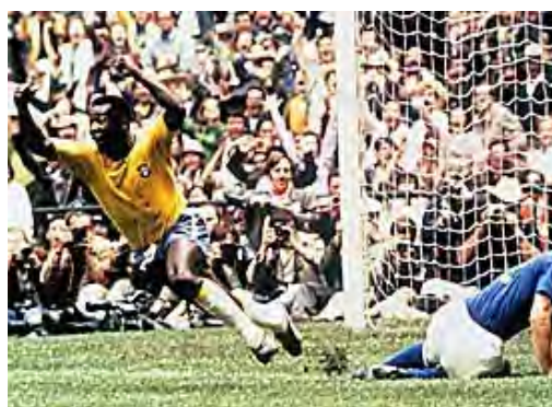
پله زنده گل اول برزیل ، در مقابل ایتالیا در فینال جام جهانی

برزیل در این جام نشان داد که این تیم تکنیکی ترین تیم دنیاست . پله که آخرین دوره شرکت در جام جهانی خود را تجربه می کرد ، ثابت کرد که او نه فقط برای فوتبال برزیل ، بلکه برای فوتبال جهان اسطوره ای تاریخی است . در دقیقه ۱۷ بازی ، این پله بود که اولین گل را وارد دروازه ایتالیا کرد .