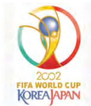
کره و ژاپن ۲۰۰۲

نخستین دوره جام جهانی هزاره سوم میلادی برای نخستین بار در تاریخ جام جهانی در خارج از دو قاره آمریکا و اروپا برگزار شد . همچنین این دوره نخستین مسابقاتی بود که به طور مشترک در دو کشور برگزار می شد .