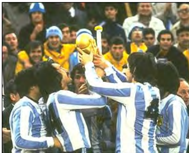
جشن آرژانتینی ها بعد از پیروزی ۳ بر ۱ هلند در وقت اضافی

آرژانتین تا دقیقه ۸۰ بازی دفاع می کرد و کمتر تمایلی به زدن گل بیشتر داشت . در دقیقه ۸۲ هلندی ها توسط نانینگا گل تساوی را زدند و قهرمانی را برای دقایقی از میزبان پس گرفتند . بازی با همان تساوی ۱-۱ در دقیقه ۹۰ تمام شد . در دقایق اضافه بازی ، تماشاگران آرژانتینی روحیه خوبی به بازیکنان خود دادند و آرژانتین توانست دو گل یکی در دقیقه ۱۰۵ (توسط ماریو کمپس) و دقیقه ۱۱۶ (توسط دانیل برتونی) وارد دروازه هلند کند تا برای نخستین بار فاتح جام جهانی شود و پس از اوروگوئه و برزیل ، سومین کشور آمریکای لاتین بود که به جام جهانی دست می یافت .