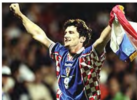
داور سوکر ، مهاجم تیم ملی کرواسی

در بازی رده بندی ، هلند ۲ - ۱ از کرواسی شکست خورد و بدین صورت شگفتی ساز جام ، کرواسی در اولین حضور خود در جام جهانی به مقام سوم رسید .