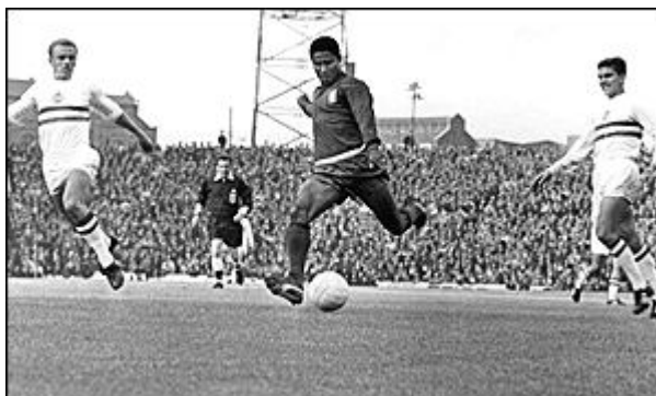
اوزه بیو ، ستاره افسانه ای پرتغال

اما از عجیب ترین اتفاق های این دوره حذف برزیل ، مدافع قهرمانی در دور مقدماتی بازی ها بود . برزیل با داشتن مجموعه ای از ستارگانی چون پله ، گارینشا ، جرزینیو و تستائو با دوشکست ۳ بر ۱ در مقابل مجارستان و پرتغال و یک برد مقابل بلغارستان حتی نتوانست از گروه خود صعود کند و تلخ ترین شکست خود را در تاریخ جام جهانی رقم زد . گرچه پله بازهم مصدوم شد ، اما ستارگان دیگر برزیل می توانستند در باخت مقابل مجارستان و پرتغال بهتر بازی کنند .