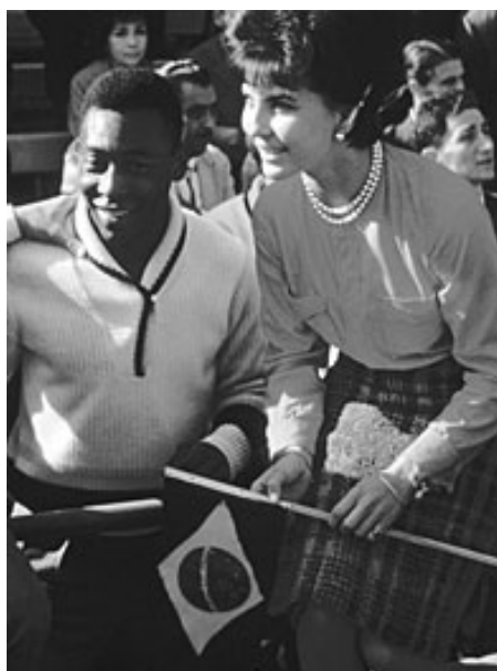
پله در کنار یک تماشاگر برزیلی

دو تیم از اروپا (یوگسلاوی و چکسلواکی) و دو تیم از آمریکای لاتین (برزیل و شیلی) به مرحله نیمه نهایی راه یافتند .