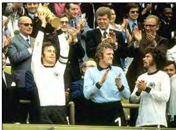
فرانس بکن باوئر در کنار سپ مایر (دروازبان آلمان) ، جام جهانی جدید را بالای سر برده است

اما آلمان غربی پس از این گل بیدار شد و شروع به حمله کرد تا اینکه در دقیقه ۲۵ آنها نیز یک پنالتی را از هلندی‌ها گرفتند . پل برایتز این پنالتی را گل کرد تا بازی مساوی شود . گرد مولر قبل از نیمه اول گلی را بثمر رساند تا آلمانیها را برای فتح جام امیدوار کند . در نیمه دوم آلمانی‌ها خوب دفاع کردند و با حذف نتیجه توانستند بازی را با همان نتیجه ۲ - ۱ برنده شوند تا برای اولین بار فاتح جام جهانی باشند . بدین صورت اولین جام جدید این بازی‌های به آلمان غربی رسید .