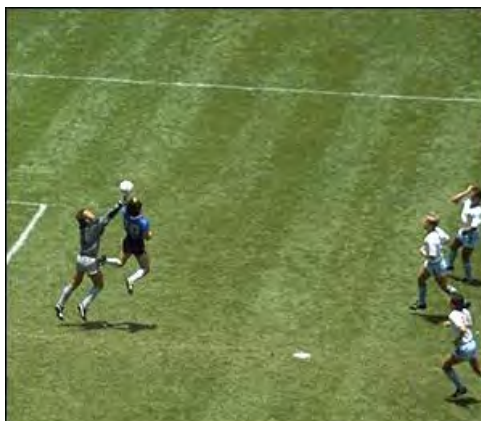
گل استثنائی مارادونا با دست به تیم ملی انگلستان

در مسابقه دیگری در این مرحله آرژانتین و انگلستان مقابل هم قرار گرفتند . این بازی با دو گل مارادونا به سود آرژانتین پایان یافت ، دو گلی که هرکدام در نوع خود پدیده ای در جام جهانی محسوب می شود . گل نخست را مارادونا پس از گذر از ۸ بازیکن انگلیسی به ثمر رساند و سه دقیقه بعد دومین گل آرژانتین پس از اینکه توپی روی سر مارادونا فرستاده شد بدست آمد . بازیکنان انگلیسی معتقد بودند که مارادونا این گل را با ضربه دستش به ثمر رسانده که داور نظری مخالف داشت و رای بر صحت گل داد .