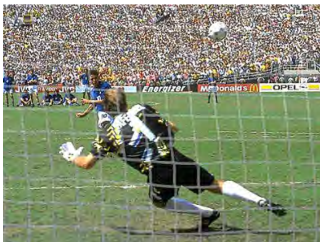
صحنه ای که روبرتو باجو پنالتی آخر ایتالیا را به بیرون زد