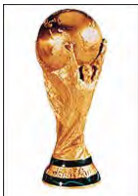
یادبود جام جهانی فیفا

برزیل در سال ۱۹۷۰ پس از سه دوره قهرمانی این جام را برای همیشه به کشور خود برد .