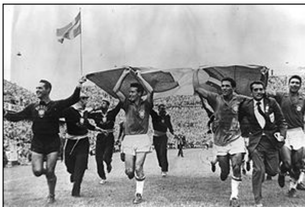
خوشحالی بازیکنان برزیل پس از قهرمانی در جام جهانی

بدین صورت برزیل بازی را ۵ بر ۲ برد تا اولین تیمی باشد که جام را خارج از قاره خود به خانه می برد (این تنها دوره ای بود که یک تیم غیر اروپایی در مسابقاتی که در اروپا برگزار می شد ، موفق به فتح عنوان قهرمانی شد) و همچنین پس از ۲۸ سال از آغاز جام جهانی و حضور در شش دوره برای نخستین بار موفق به فتح این جام شد .