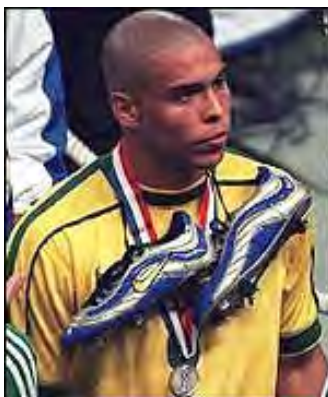
رونالدو ستاره تیم ملی برزیل

رونالدوی برزیلی از سوی فیفا به کفش طلایی دست یافت .