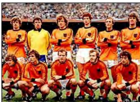
ستارگان هلند در فینال جام جهانی ۱۹۷۸

فینال بین تیمهای آرژانتین (میزبان بازیها) و هلند (نایب قهرمان جام قبل) برگزار می شد . هلند که دو بار پیاپی به فینال می رسید تقریباً همان ترکیب سال ۱۹۷۴ خود را حفظ کرده بود با این تفاوت که دیگر یوهان کریوف ، ستاره خود را در اختیار نداشت .