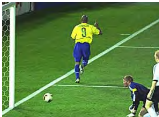
کان در مهار ضربه ریوالدو ناکام بود و رونالدو این توپ را به گل تبدیل کرد

در نیمه اول بازی نزدیک دنبال شد . هر دو تیم موقعیتهایی را برای گلزنی داشتند اما این نیمه ۰ - ۰ به پایان رسید . در دقیقه ۶۷ ریوالدوی برزیلی ضربه را به سمت دروازه اولیور کان زد ، کان در مهار مستقیم آن ناکام بود تا اینکه در برگشت توپ ، رونالدو توپ را وارد دروازه کرد .