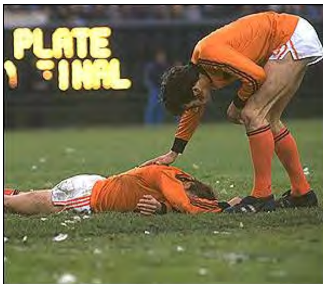
ناراحتی بازیکنان هلند بعد از باخت در مقابل آرژانتین در فینال ۱۹۷۸

در دیدار رده بندی دو تیم ایتالیا و برزیل به مصاف هم رفتند که این بازی ۲ - ۱ به نفع برزیل تمام شد و این تیم به مقام سوم جام رسید .