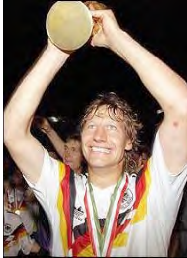
گوئیدو بوچوالد ، جام را در دست گرفته است

فرانس بکن باوئر ، ستاره فوتبال آلمان مشهور به "قیصر" که در سال ۱۹۷۴ به عنوان کاپیتان آلمان غربی با این تیم قهرمان شده بود ، در جام ۱۹۹۰ ایتالیا ، در نقش مربی این تیم بار دیگر به این عنوان دست یافت .