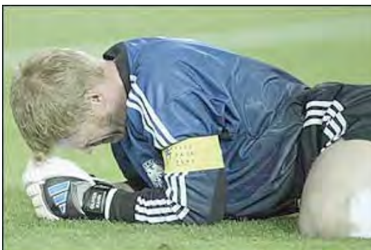
لیور کان (دروازه بان آلمان) ، به عنوان بازیکن برتر جام انتخاب شد

لیور کان ، کاپیتان و دروازه بان آلمان از سوی فیفا به عنوان بازیکن برتر جام انتخاب شد .