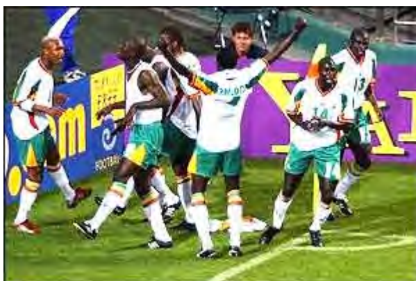
خوشحالی سنگالی ها بعد از گل به فرانسه

اما کره جنوبی ، ژاپن و ترکیه (که فقط یک بار دیگر و آن هم در سال ۱۹۵۴ در جام جهانی حضور داشت) ، نیز از شگفتی سازان دیگر این جام به شمار می آیند .