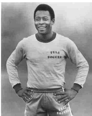
پله پدیده تیم ملی برزیل

در دیدار رده بندی ، فرانسه ۶ بر ۳ آلمان غربی را برد و به مقام سوم رسید .