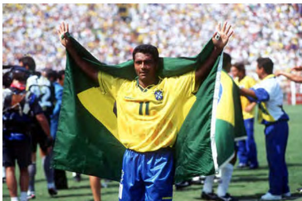
روماریو ستاره بی چون و چراى گلزنى در برزیل