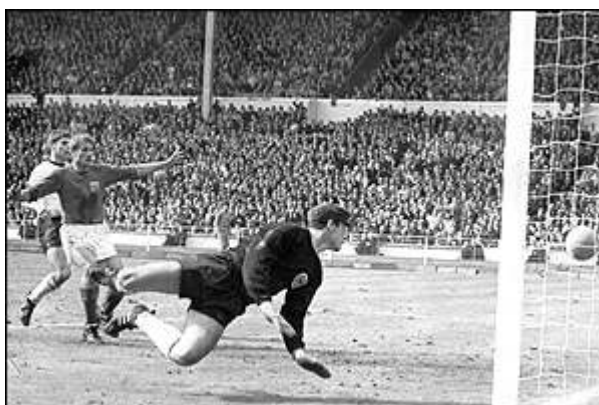
گل تساوی تیم انگلیس ، توسط جف هورست در فینال ۱۹۶۶

فینالی که در شهر لندن برگزار شد با تساوی ۲ بر ۲ در وقت قانونی به پایان رسید . در یک بازی بسیار نزدیک ، این آلمانیها بودند که در دقیقه ۱۲ توسط هالر گل اول بازی را بثمر رساندند . اما میزبان جام توسط مهاجم خود ، هورست ، در دقایق پایانی نیمه اول بازی را مساوی کرد .