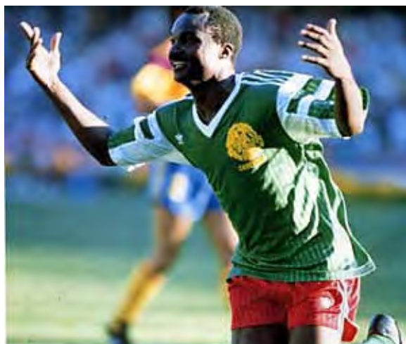
روژه میلا با این گل ، به عنوان مسن ترین گلزن تاریخ جام جهانی انتخاب شد

روژه میلا در جام جهانی ۱۹۹۴ ، در حالی که ۴۲ ساله شده بود برای تیم ملی فوتبال کامرون به میدان آمد و جالب است بدانید که در دیدار تیم ملی کامرون مقابل تیم ملی روسیه او حتی موفق شد در سن ۴۲ سالگی گل بزند .