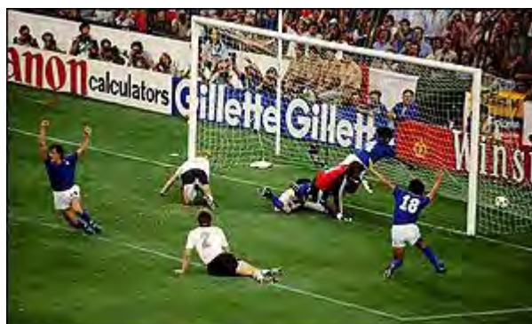
پائولو روسی مهاجم ایتالیا ، گل اول را وارد دروازه آلمان غربی کرد

نیمه اول بازی گلی را دربر نداشت . ایتالیایی ها در این نیمه صاحب یک ضربه پنالتی شدند اما نتوانستند از آن نتیجه بگیرند . بالاخره در دقیقه ۵۷ (نیمه دوم) پائولو روسی مهاجم ایتالیایی گل اول بازی را برای تیمش به ثمر رساند .