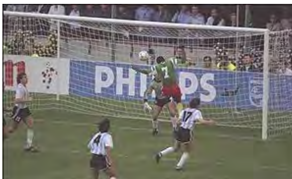
گل پیروزی بخش تیم کامرون برابر آرژانتین

شگفتی این جام را همان روز نخست ، تیم کامرون پدید آورد . این تیم توانست در بازی افتتاحیه آرژانتین را با حضور استوره افسانه ایش ، یعنی مارادونا ۱ - ۰ شکست دهد .