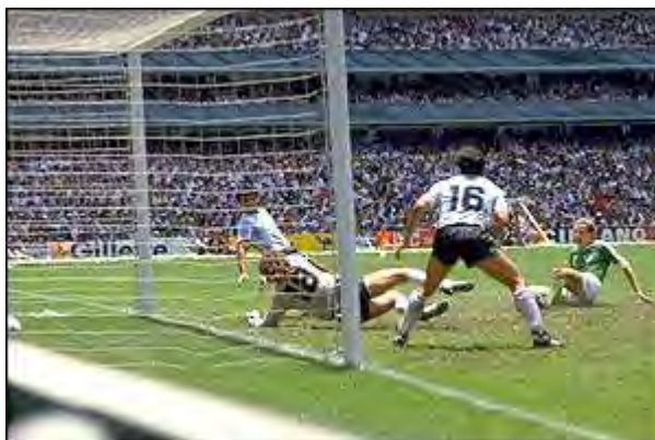
گل رومنیگه به تیم ملی آرژانتین در فینال

بازی بین آلمان غربی و آرژانتین در ورزشگاه آتک برگزار شد . از این بازی ۱۱۴ هزار و ۶۰۰ نفر در ورزشگاه دیدن می کردند . این بازی را می توان یکی از پرنوسان ترین فینالهای جام جهانی نام برد . آرژانتین نیمه با زدن یک گل (در دقیقه ۲۳) تحت کنترل خود گرفت . دهه دقیقه پس از آغاز نیمه دوم آرژانتین توسط والدانو گل دوم خود را وارد دروازه کرد . همه فکر می کردند کار برای آلمانیها تمام شده است تا اینکه رومنیگه در دقیقه ۷۴ و فولر در دقیقه ۸۰ دو گل برای آلمان وارد دروازه آرژانتین کردند .