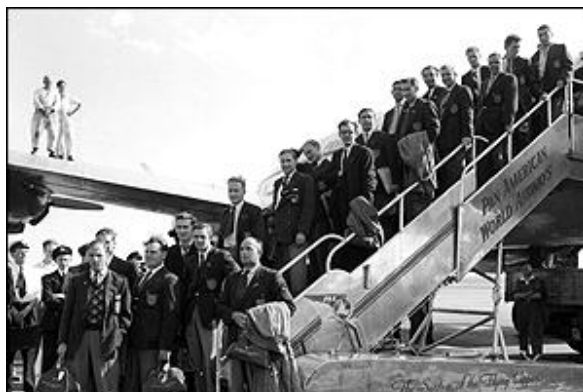
بازگشت تیم انگلیس با رسوایی بعد از شکست یک بر صفر از آمریکا

تیمهای برزیل ، اروگوئه ، سوئد و اسپانیا به عنوان برندگان چهار گروه به مرحله بعد صعود کردند . برزیل که از شرایط میزبانی بهره می برد توانست تیمهای سوئد و اسپانیا را به ترتیب ۷ - ۱ و ۶ - ۱ شکست دهد. از طرفی اروگوئه نیز این دو تیم را شکست داد تا به دیدار پایانی برسد .