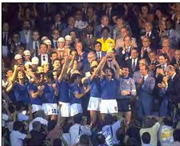
ایتالیایی ها بعد از ۴۴ سال قهرمان جام جهانی شدند

ایتالیا با این پیروزی پس از ۴۴ سال به قهرمانی جام رسید و پس از برزیل دومین تیمی بود که سه بار قهرمان جام می شد .