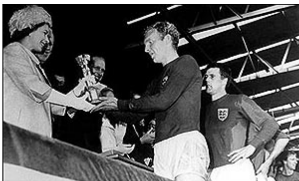
بابی مور جام قهرمانی را از ملکه انگلیس دریافت می کند