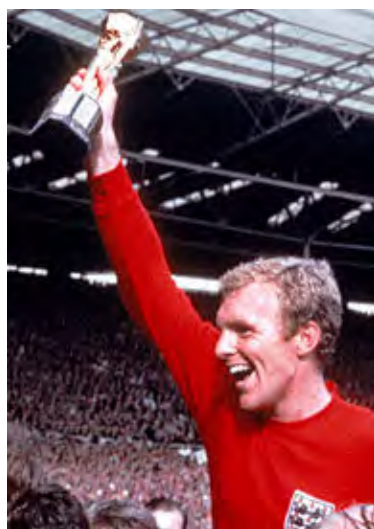
بابی مور و جام زول ریمه

در بازی رده بندی ، پرتغال ۲ به ۱ اتحادیه جماهیر شوروی را شکست داد تا تیم سوم جام باشد .