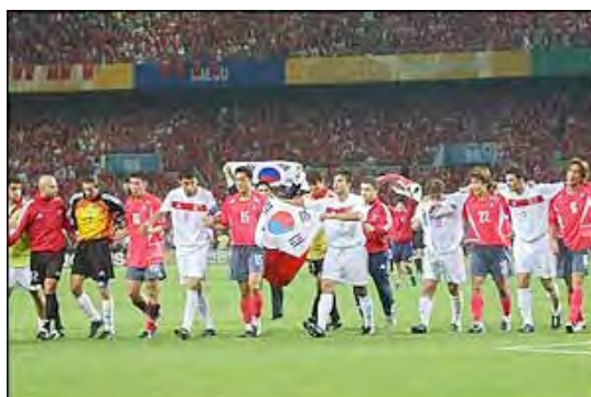
بازیکنان کره جنوبی و ترکیه بعد از پایان بازی رده بندی

بازی رده بندی را ترکیه ۳ - ۲ از کره جنوبی برد و توانست بزرگترین افتخار تاریخ فوتبالش را رقم بزند . گل هاگان شوکور در ثانیه یازدهم این بازی سریعترین گلی است که در تاریخ جام جهانی به ثبت رسیده است .