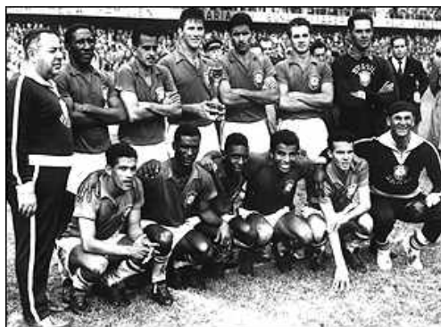
تیم ملی برزیل فاتح جام جهانی ۱۹۵۸ سوئد

با بارش بارانی که در استکهلم هنگام بازی فینال صورت گرفت ، همگان بر این باور بودند که جام در سوئد باقی خواهد ماند . سوئد نیز از این وضعیت استفاده کرد و در دقیقه چهارم اولین گل بازی را به ثمر رساند . اما واوا از برزیل در دقیقه پایانی نیمه اول دو گل زد تا تیمش با خیال راحت به رختکن برود . نیمه دوم بازی ، نیمه پله بود . جوان ۱۷ ساله ای که با حرکات خیره کننده خود سومین گل تیمش را بثمر رساند . دقایقی بعد ، زاگالو نیچه را ۴ بر ۱ کرد . در دقیقه ۸۹ پله جوان بازم خوش درخشید و بازی را ۵ به ۱ کرد . لحاظاتی بعد ، سیمونسن سوئدی یکی از گلهای خورده تیمش را جبران کرد اما این برای قهرمانی کافی نبود .