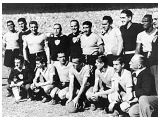
اروگوئه قهرمان جام جهانی ۱۹۵۰ برزیل

این بازی با همان نتیجه ۲ بر ۱ به سود اروگوئه تمام شد و این تیم برای دومین مرتبه قهرمان جام شد .