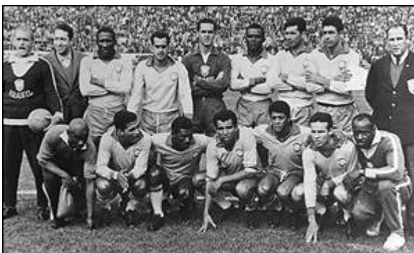
قهرمان جام جهانی (برزیل) ، در فینال ۱۹۶۲ شیلی

در دقیقه ۷۸ ، واوا همه چیز را تمام کرد و با زدن گل سوم برزیل ، کار را برای چک اسلواکی تمام شده جلوه داد . تا برزیل برای دومین بار پیاپی فاتح جام شود .