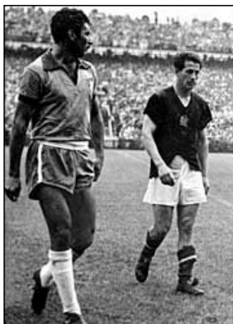
اخراج یک بازیکن از برزیل و یک بازیکن از مجارستان در این بازی

در دیداری که تیم مجارستان با برزیل در چهارچوب این جام انجام داد ، موفق شد این تیم را ۴ به ۲ شکست دهد . این بازی در آخر به جدال کشیده شد طوریکه پلیس سوئیس برای جدا کردن بازیکنان وارد میدان شد . از این بازی به عنوان "جنگ برن" یاد می شود .