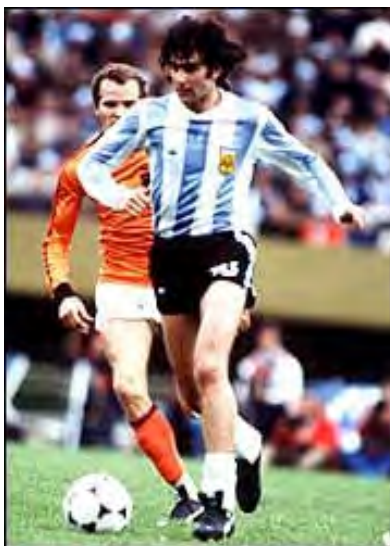
ماريو کمپس ، بهترين بازيکن جام جهاني ۱۹۷۸