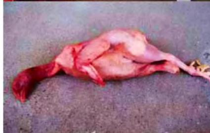
زمانی که مرغها به صورت زنده در مخازن پرکنی سوزانده می شوند رنگ پوست آن ها قرمز روشن می شود.