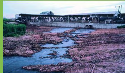
تصویر آب های روان دامداری ها که اغلب، آب های زیر زمینی را آلوده می سازد.

«خیلی وقت ها خوک هایی را می بینم که با ضربه اول نمی میرند، حتی با ضربه دوم هم نمی میرند. در این وقت ها صدای جیغ زدن می شنوید، جهش های خونی را می بینید در حالی که چشم ها به سمت بیرون پف کرده اند.» یک کارگر مزرعه پرورش خوک در داکوتای جنوبی