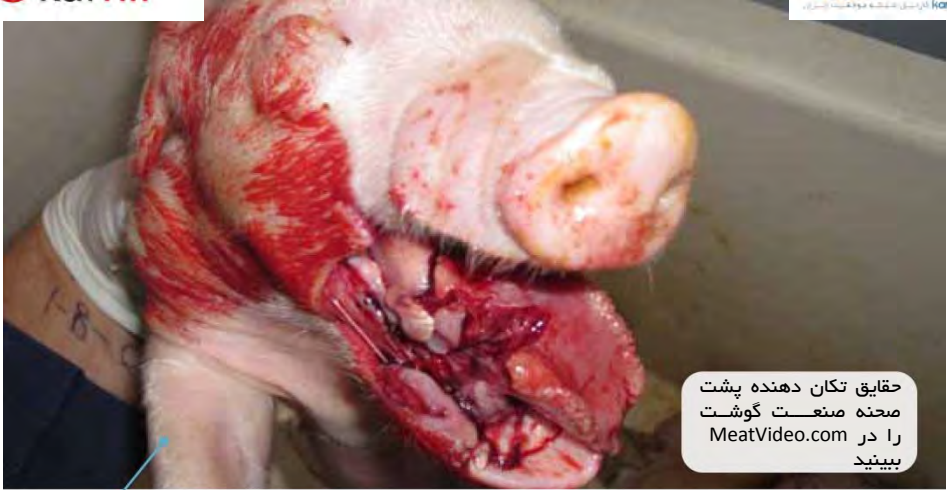
حقایق تکان دهنده پشت صحنه صنعت گوشت را در MeatVideo.com ببینید