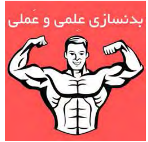
اطلاعات بیشتر و دریافت