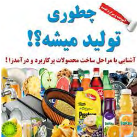
اطلاعات بیشتر و دریافت