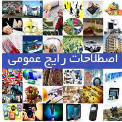
اطلاعات بیشتر و دریافت