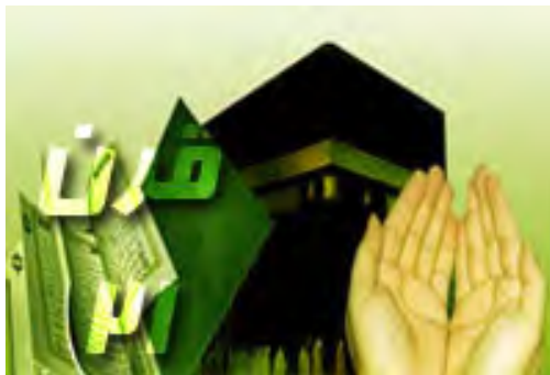
شکل ۱. تکنولوژی با دین در قرن بیست و یکم مواجه می‌شود.

می‌تواند از بنیانی وسیع‌تر بهره‌مند شود. به عبارت دیگر، ما کارِ توأمانی را دربارهٔ اینکه چگونه هریک می‌توانند به دیگری کمک نمایند، هویدا می‌سازیم. شکل یک به صورتِ مصوّر این همکاری تکنولوژی و دین را توضیح می‌دهد که متن حاضر آن را می‌کاود.