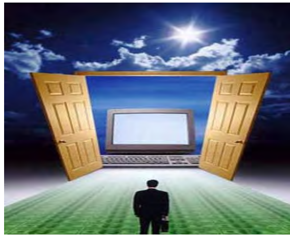
شکل ۲. الهیات تکنولوژی

یا شیوه‌های بیانِ دین و «ایمان» در آن گونه محیط‌هاست؛ یا استعاره‌هایی است که چنان محیطی می‌تواند دربارهٔ خداوند فراهم آورد. شکل ۲ «تأثیری را که الهیات بر تکنولوژی می‌گذارد، نشان می‌دهد، در واقع به منظور کمک به تمایز بخشیدنِ «الهیات تکنولوژی» از الهیاتِ سایر، آنجا که «الهیات و تکنولوژی» با الهیات متعارف در یک ردیف قرار می‌گیرند. همان‌طور که به وسیلهٔ مسیح و صلیب بازنمایی شدند و به تفوقِ حاکمِ عالی مقام تداوم بخشیدند.