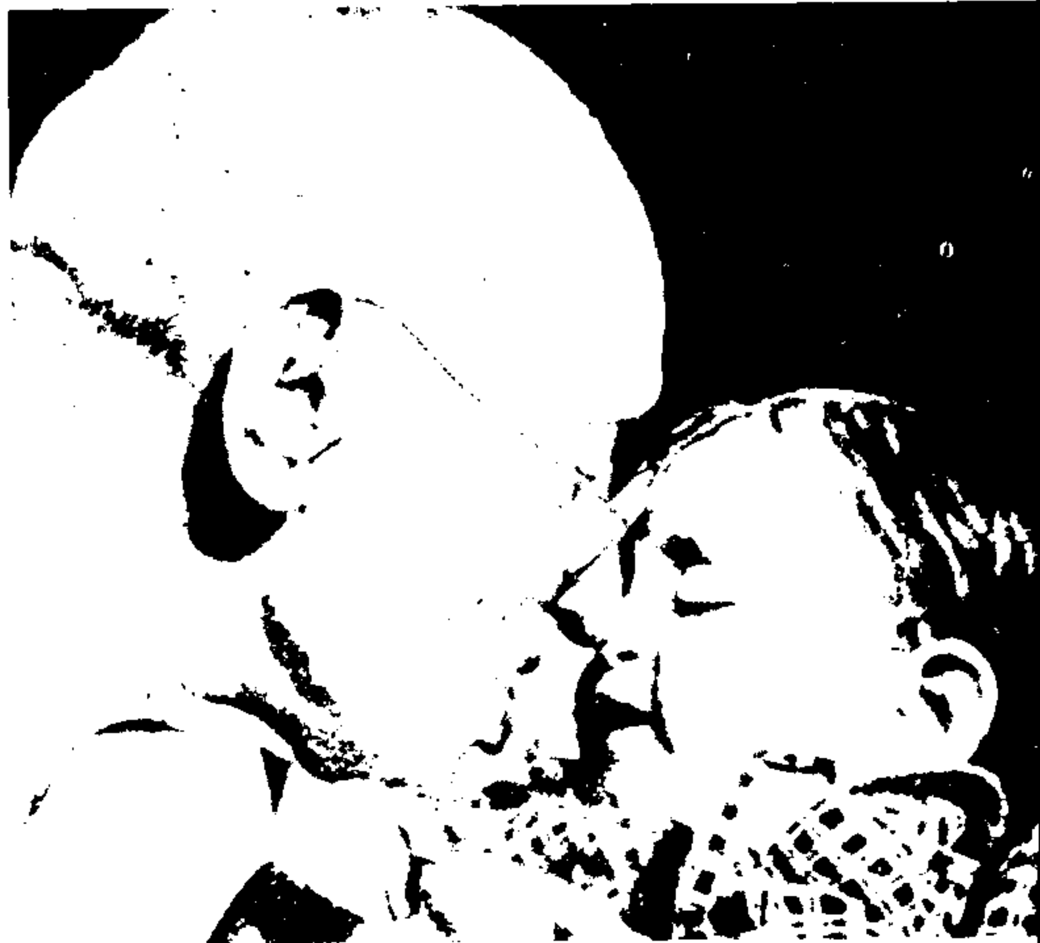
کودکان را دوست می‌داشت