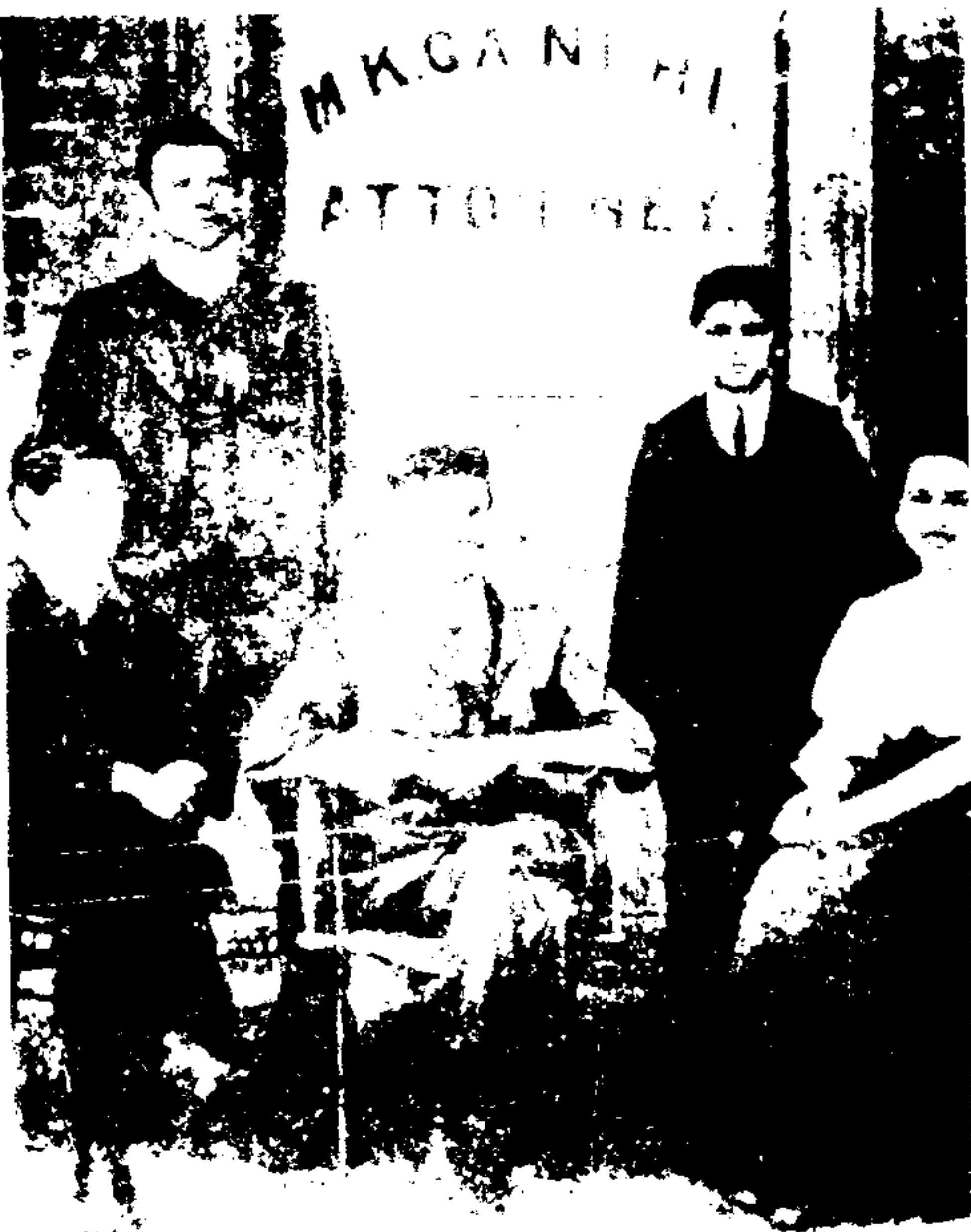
با همکاران خود در یوهانسبورگ (آفریقای جنوبی)