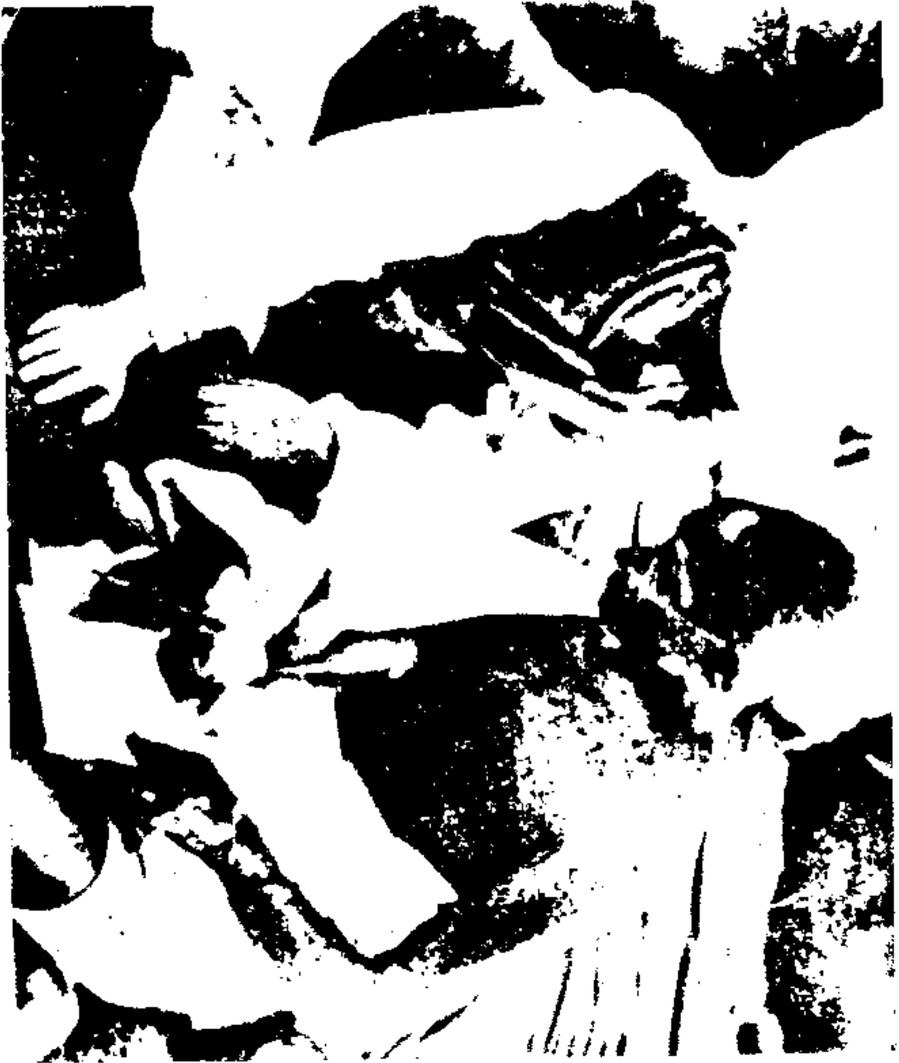
با جوهر لعل نثرو