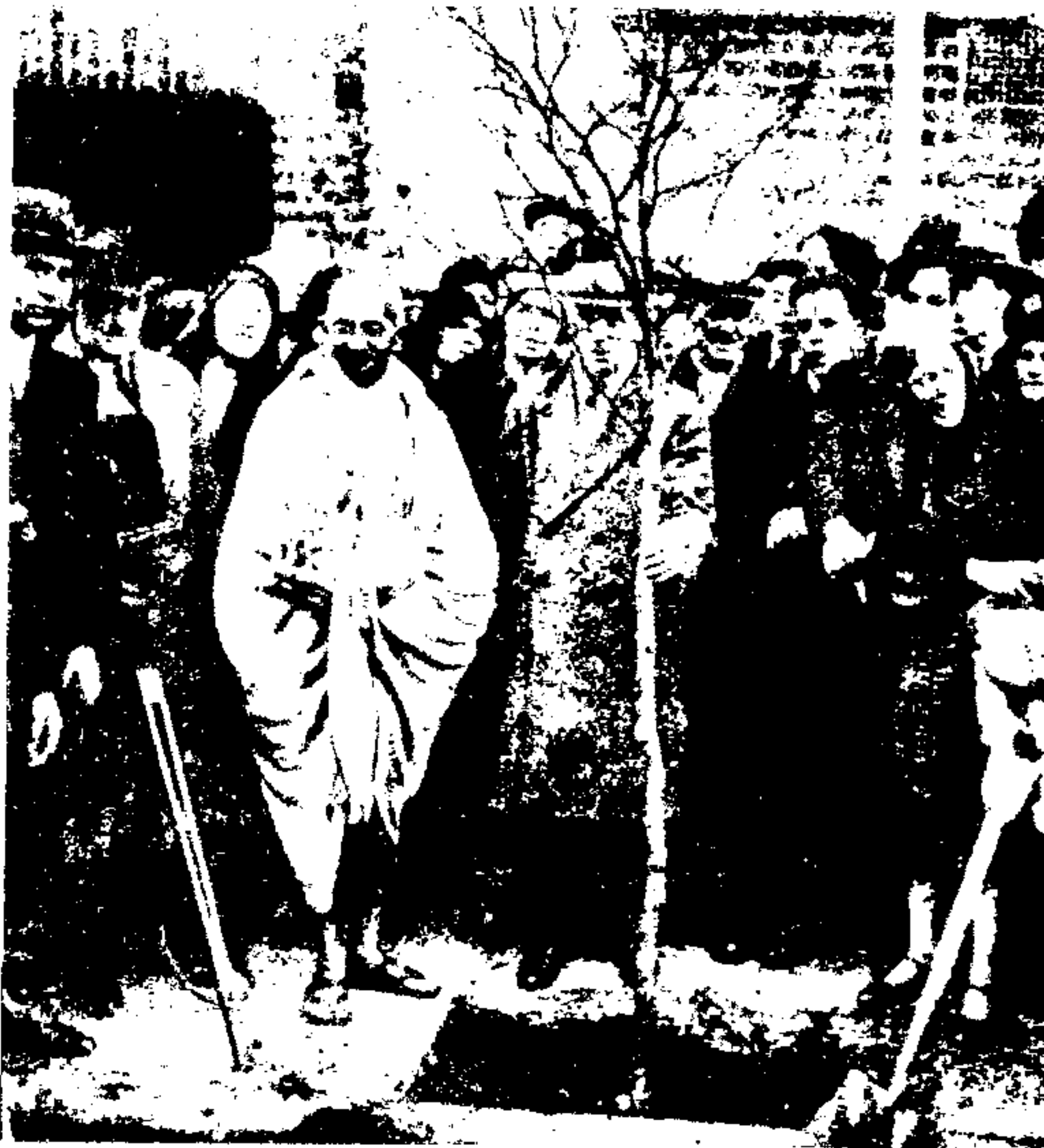
در مراسم درختکاری ، لندن