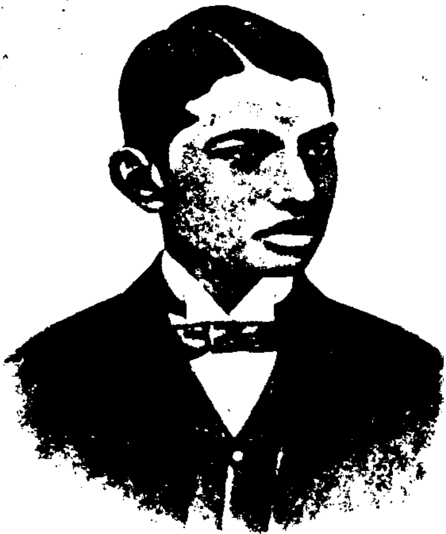
هنگامی که در انگلستان دانشجو بود (۱۸۸۸ م.)