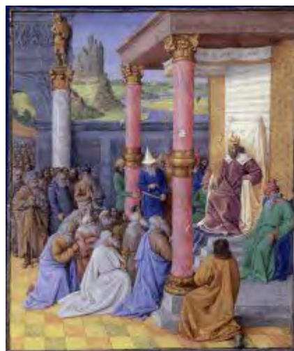
:: کوروش در بابل ::

باشد دل ها شاد گردد. بشود، خدایانی که آنان را به جایگاه های مقدس نخستین شان بازگرداندم، هر روز در پیشگاه خدای بزرگ برایم زندگانی بلند خواستار باشند. بشود که سخنان پربرکت و نیکخواهانه برایم بیابند. بشود که آنان به خدای من مردوک بگویند: "به کوروش شاه، پادشاهی که تو را گرامی می دارد و پسرش کمبوجیه، جایگاهی در "سرای سپند" ارزانی دار". من برای همه مردم جامعه ای آرام فراهم ساختم و صلح و آرامش را به تمامی مردم اعطا کردم.