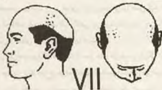
محدوده ناحیه دهنده در پشت سر