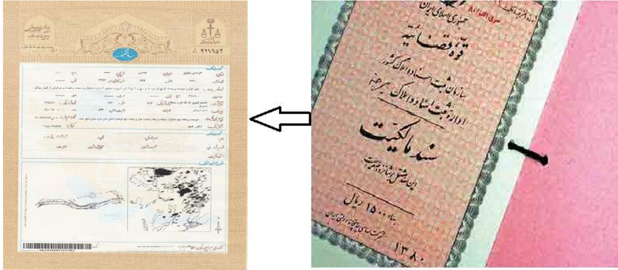
تبدیل سند های مشاعی به سند شش دانگ