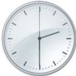
saat iki buçuk