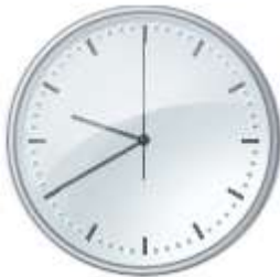
saat ona yermi var