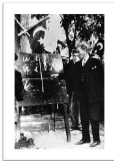
آتا ترک و تدریس نمادین ۲۹ حرف جدید ترکی در شهر سینوپ ۱۹۲۸ میلادی.

الفبای ترکی استانبولی که به موجب قانون شماره ۱۳۵۳ در تاریخ ۱ نوامبر ۱۹۲۸ به تصویب رسیده، شامل ۲۹ حرف است که هر کدام از این حروف اعم از صامت و یا مصوت دارای اشکال و صداهای متفاوت و منحصر به فردی بوده و از این رو فراگیری و یاد گرفتن این حروف و متعاقب آن قرائت کلمات با این حروف بسیار سهل و آسان است. از آنجایی که از تدوین الفبای جدید زبان ترکی استانبولی، زمان زیادی نمی‌گذرد و این که به ازای هر حرف یک صدا و به ازای هر صدا یک حرف وجود دارد این زبان همانطور که نوشته می‌شود خوانده می‌شود و بالعکس. از ۲۹ حروف مختلف این زبان ۸ تای از آن‌ها صدادار (مصوت) هستند که این دسته خود به دو گروه تقسیم می‌گردند: گروه حروف‌های صدادار خشن یا پسین و گروه حروف صدادار پیشین و یا ظریف.