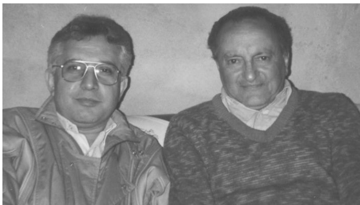
اردیبهشت ۱۳۷۲ شہسوار، خانہی ارسلان پوریہا، یک سال پیش از درگذشت او