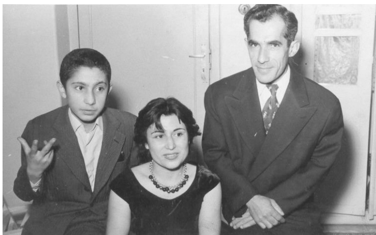
۱۳۳۳ به ہمراہ پدر و مادر