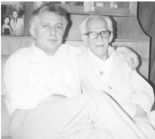
۱۳۷۲ با پدر یکسال پیش از درگذشتش