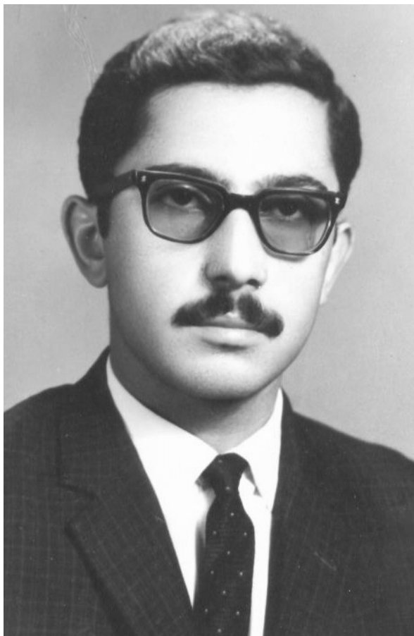
امرداد ۱۳۴۴ پس از آزادی از زندان