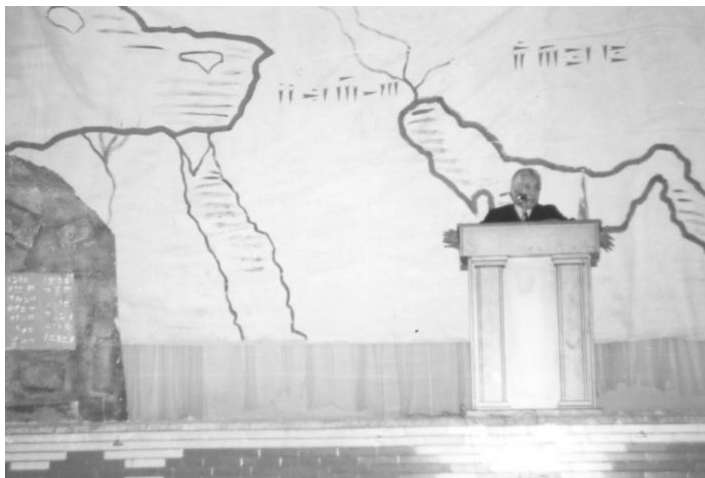
سخنرانی در آذر ۱۳۸۳