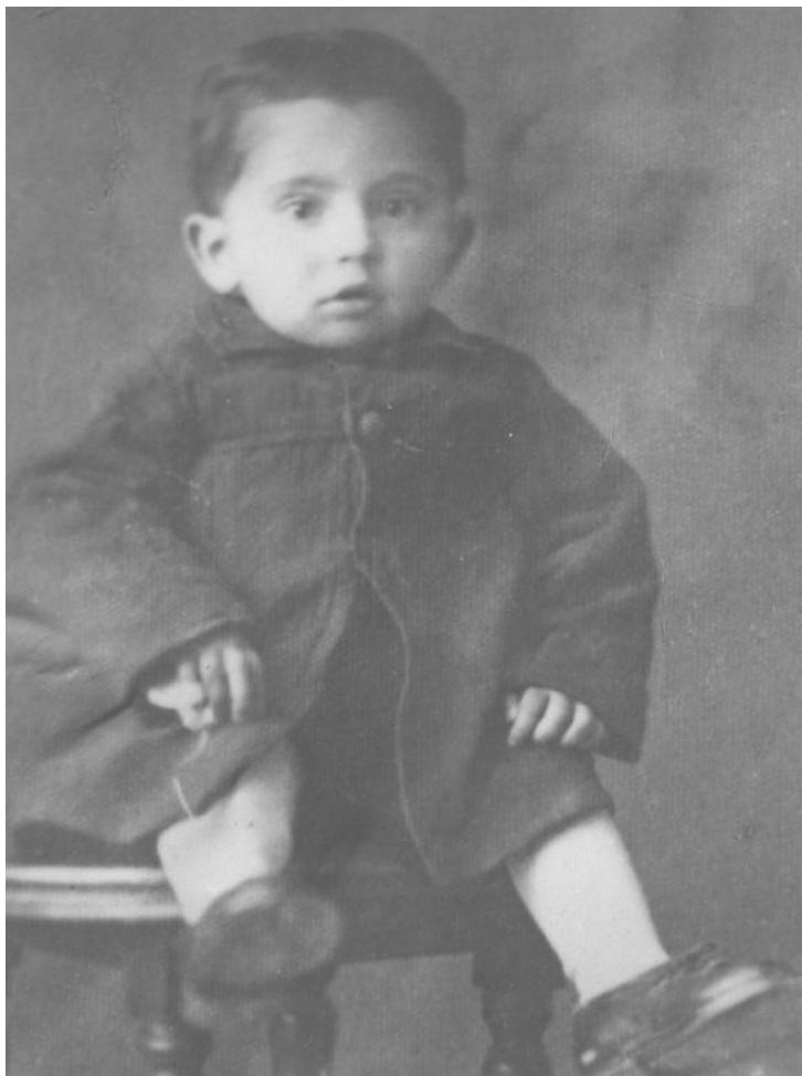
دی ماه ۱۳۲۱