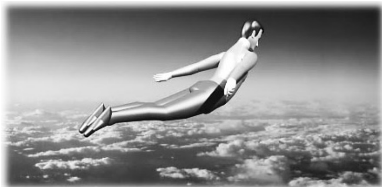
پرواز بر فراز ابرها

در عالم رویاها هیچ چیز غیرممکن نیست! و این امر به میزان اعتماد به نفس ما بستگی دارد؛ یعنی ما می‌توانیم (در عالم خواب) به هر اندازه که دوست داریم توانمند باشیم. ما در عالم رویاها کاملاً فناپذیر و به شدت قوی هستیم؛ و در واقع قدرت ما فقط حاصل قدرت ذهنی ماست. با انجام تمرینات صحیح، تمرکز کافی و بهره‌گیری از دو عامل بالا، می‌توانیم تمامی نیروهای موجود در عالم خواب را تحت کنترل خویش درآوریم.