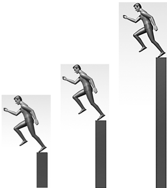
پریدن از ارتفاع ۱ متری « هفته‌ی اول »

راه‌های زیادی برای از بین بردن این ترس وجود دارد؛ و شما یکی از ساده‌ترین و مؤثرترین روش‌ها را در اینجا می‌آموزید؛ و اما راه از بین بردن ترس از سقوط: پس از اطمینان از خواب بودن! بالای یک صندلی بروید؛ و به خود بگویید: این فقط یک خواب است! جاذبه‌ی زمین خیلی کم است! پس من به سبکی یک پر هستم! سپس به پایین بپرید. چشم‌هایتان را باز نگاه دارید و سعی کنید بیدار نشوید. تعجب نکنید! حتی همین ارتفاع کم، هم می‌تواند موجب بیدار شدن شما شود! با تکرار این تمرین، کم‌کم سرعت سقوط شما کاهش یافته تا جایی که (در صورت سقوط) با سرعت یک پر به زمین خواهید رسید!