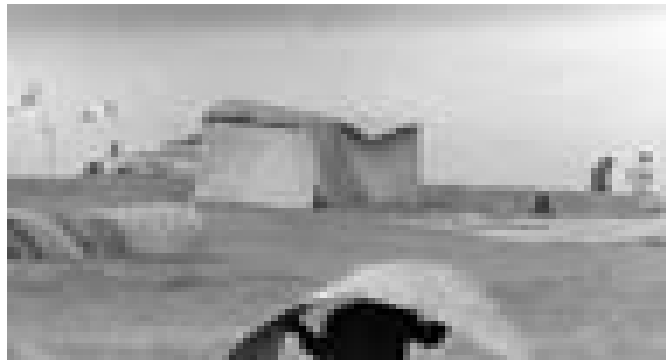
شکل ۲-۲ نخستین گام

سرانجام اینکه ساخت‌وساز غیررسمی یک جنبه سیاسی قابل توجه داشته است؛ چرا که در تحلیل نهایی فقط مالکان ملک و دارایی برای کسب حقوق خود حاضر به مبارزه هستند. فقط وقتی کسی صاحب حق بر چیزی باشد حس مسئولیت، مبارزه و چالش سیاسی دارد. کشورهای بدون مالکیت خصوصی، کشورهایی هستند که جامعه مدنی ضعیف دارند و شهروندان با قدرت سیاسی به معارضة بر نمی‌خیزند؛ چون فضای بسیار اندکی برای توسعه فردی باقی مانده است.