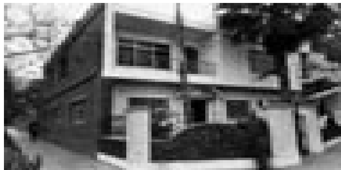
شکل ۲-۵ مسکنی که قبلاً خارج از قانون بود