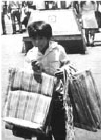
شکل ۲-۶ دست‌فروش خیابانی

مجبور نیستند باهوش باشند تا پول درآورند، فقط کافی است سازمان‌دهی شوند؛ اینکه آنها مجبور نیستند نابغه باشند تا فرصت‌ها را کشف کنند، فقط کافی است بی‌باک باشند.