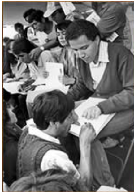
شکل ۱-۳ تکمیل فرم‌های مالکیت

سازگاری دارد. مهم‌تر از همه آنکه دولت پرو، به‌منظور قانونگذاری، اینک نه به نام یک ایدئولوژی خارجی، فیلسوفانی که مردم هرگز نامشان را نشنیده بودند یا دستورات یک نهاد مالی بین‌المللی، بلکه با اتکا به تهی‌دستان و پشتیبانی آنها می‌توانست در جهت اجرای اصلاحات فشار آورد. دولت می‌توانست اصلاحات عمده را به نام تهی‌دستان ملت به جریان اندازد. این شیوه به ما اجازه داد تا گذار به سرمایه‌داری و دموکراسی لیبرال را دست‌کم برای مدتی به آنچه همیشه باید باشد یعنی آرمان بشردوستانه واقعی، مبارزه‌ای صادقانه علیه محرومیت، ریشه یافته در بهترین منافع ملت تبدیل کنیم. این موارد استدلال فوق‌العاده‌ای در اختیار رئیس‌جمهور پرو گذاشت: «اکثریت جمعیت کشور از اقتصاد بازار رسمی و دسترسی به سرمایه دور افتاده است به همان شدتی که روزگاری آپارتاید در آفریقای جنوبی سیاه و سفید را از هم جدا می‌ساخت و ما در صدد تصحیح آن هستیم».