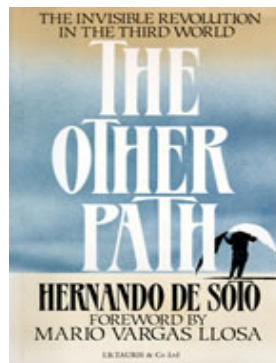
شکل ۱-۲ جلد کتاب راه دیگر

مجله /کونومیست: راه دیگر دستاورد ارزشمندی است. این کتاب باید عامل محرک دولت‌های آمریکای لاتین و راهنمای عمل همه کسانی باشد که به تهی‌دست‌ترین اقشار جامعه کمک می‌کنند. کتابی جذاب که با شرحی دقیق و مفصل نشان می‌دهد چگونه گروه‌های تهی‌دستی که زمین‌ها را به تصرف خود درآورده‌اند، سازمان‌یافته تلاش می‌کنند خانه‌هایی را که ساخته‌اند، قانونی کنند. چگونه از روش‌های ابتدایی ثبت زمین استفاده می‌شود. چگونه دست‌فروشان خیابانی بساط خود را در خیابان‌ها پهن کرده و سرانجام بازارهای مخصوص به خود را ایجاد می‌کنند و چگونه خدمات مسافری درون شهری بخش غیررسمی، برنامه‌ریزی شده و گسترش می‌یابد. مجله فوربس: راه دیگر اثر مهمی است که مقدر شده است تا شیوه درک جهان از فقر و ثروت را تغییر دهد. این کتاب از کینز و مارکس هم فراتر رفته و قلب متناقض‌نمای اقتصادی گسترش فقر، در دنیایی که روزبه‌روز ثروتمندتر می‌شود را نشانه می‌رود.