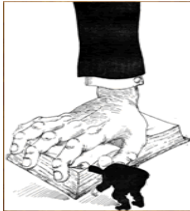
شکل ۳-۳ اطلاعات عمومی

۱۳۴ آموزه‌های بهبود محیط کسب و کار قضیه را پیگیری کنند. به این ترتیب فشاری از طرف افکار عمومی ایجاد می‌شد که سیاستمداران نمی‌توانستند آن را نادیده بگیرند.