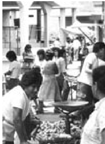
شکل ۸-۲ بازار جدید

خیابان‌های آمریکای لاتین بهترین مدارس بازرگانی برای کارآفرینانی شده است که عزم جدی، صداقت و بی‌باکی دارند. بنابراین آن خیابان‌هایی که فعالیت‌های کارآفرینی را به حرکت درآورد به بهترین استدلال در دفاع از کسب‌وکار آزاد و سرمایه‌داری در آمریکای لاتین تبدیل شده است.