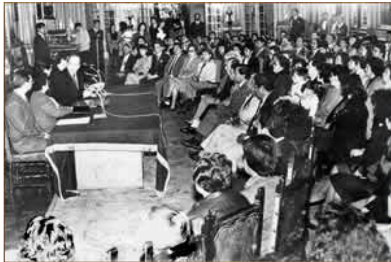
شکل ۳-۵ دادگاه ساده‌سازی امور اداری

شکایت‌ها هر دو هفته یک بار صبح شنبه، در هیئت داوری که به صورت زنده از تلویزیون پخش می‌شد مورد رسیدگی قرار می‌گرفت. این «دادگاه‌های ساده‌سازی امور اداری»، که تحت مدیریت مؤسسه آزادی و دموکراسی به ریاست رئیس جمهور برگزار می‌شد، رتبه‌هایی از نظر تعداد بیننده کسب کرد که مایه حسادت هر مجموعه تلویزیونی سرگرم‌کننده بود؛ پروپی‌ها جلوی گیرنده‌های تلویزیونی خود می‌نشستند و از مشاهده هزاران نوع گره که سد راه زندگی آزاد آنها بود می‌شدند. زمان مورد نیاز برای طی کردن صدها نوع مراحل اداری، شامل گرفتن گذرنامه، درخواست تحصیل در دانشگاه و سند ازدواج در مجموع دست کم ۷۵ درصد کاهش یافت. دریافت مجوز ازدواج که سابق بر این نیاز به گذر از هفت‌خوان اداری داشت و ۷۲۰ ساعت زمان می‌برد به ۱۲۰ ساعت کاهش یافت و بنابراین به زنان کمک کرد تا از حقوق خود به عنوان شریک ازدواج مطمئن باشند. قانونی که این رویه‌ها را به وجود آورد، سازوکارهایی نیز در خود داشت که به دولت اجازه می‌داد اکثر اصلاحات تعدیل ساختاری مورد نیاز برای قرار دادن پرو در اقتصاد جهانی را اجرا کند.