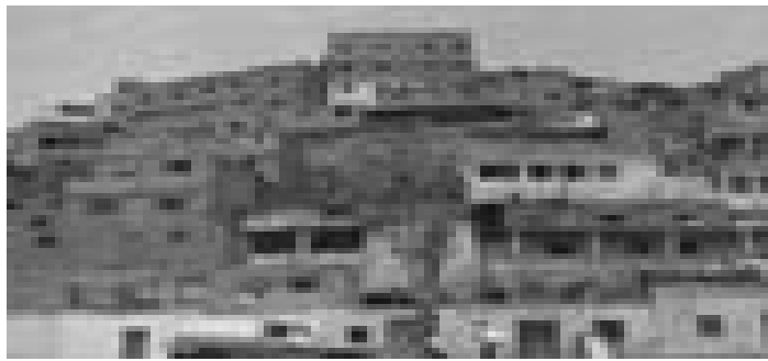
شکل ۲-۴ شهری شدن