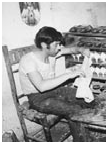
شکل ۲-۷ کارگاه کفش زیرزمینی