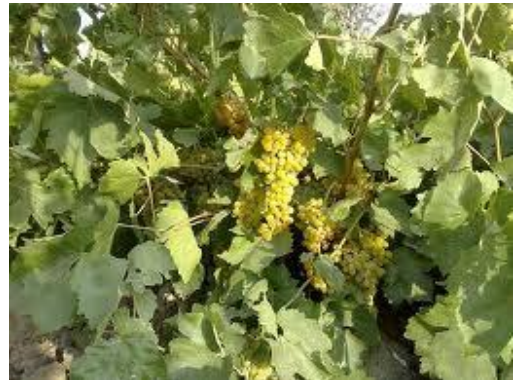
(د) مرحله برداشت :